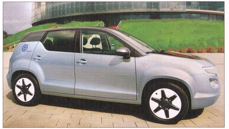
Karmann-Elektroauto E3: Die Kleinwagen des Osnabrücker Zulieferers dienen als Versuchsträger für das EWE-Projekt „Grid Surfer“.

Ein Problem können die Entwickler allerdings nicht selbst lösen, so Schulte-Hillen: „Der Fahrer muss dazulernen und vor Fahrtantritt grundsätzlich sein Ziel eingeben. Und das haben wir nicht in der Hand.“ Michael Knauer